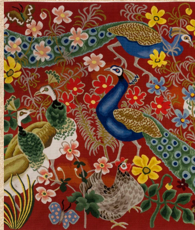
Dom Robert - L'Été (extrait) Tapisserie conservée au Musée Dom Robert et de la tapisserie du XX e siècle de Sorèze.

Destinations Tarnaises & Espace Randos Hôtel Reynès - 14 Rue Timbal - 81000 ALBI Tél. 05 63 47 73 06 www.randonnee-tarn.com info@rando-tarn.com